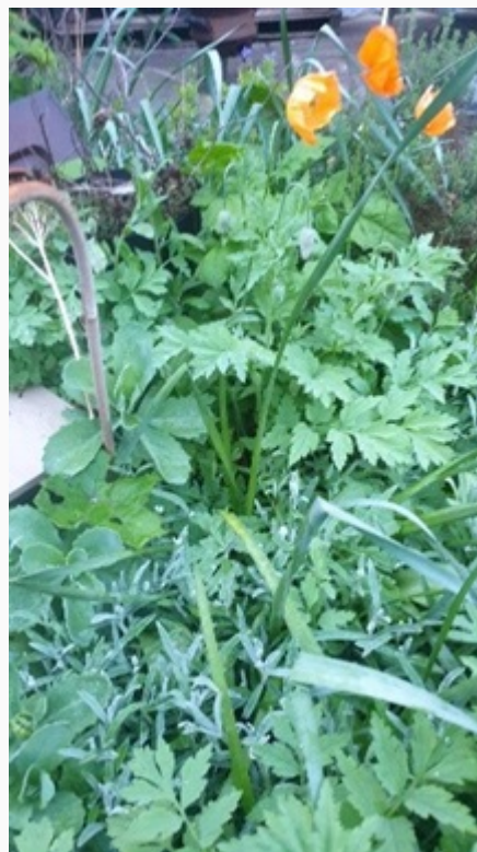
Mirjam in Wageningen