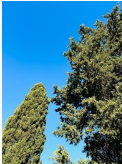
Gery in Toscane