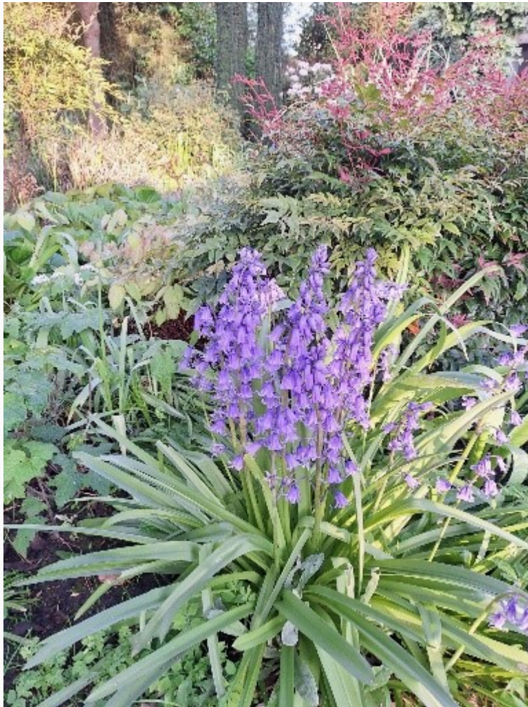
Murielle in Eersel